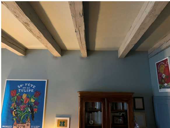
Solive apparente au 2 ème étage