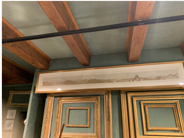
Solive apparente au rez