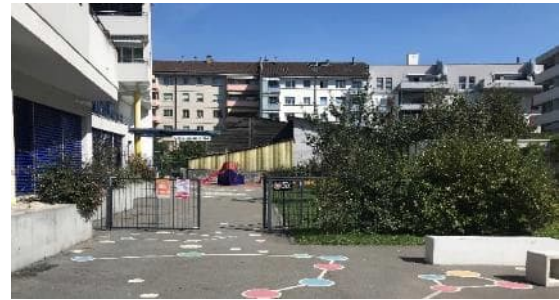
Vue d'une des cours du Collège Square central