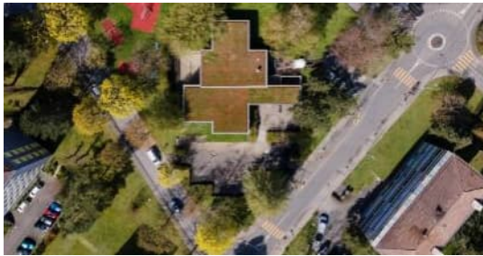
Collège de la Vogéaz en 2023