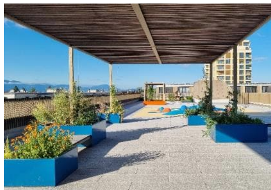
Préau en toiture du Collège J.-Dubochet en 2024