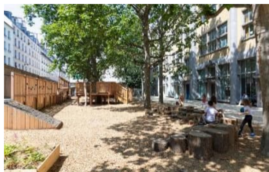
École élémentaire Keller Avant/Après - © CAUE de Paris