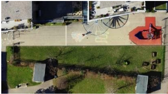
Collège Square central en 2023