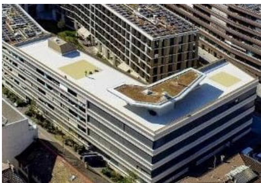
Préau en toiture du Collège J.-Dubochet en 2021

Ces aménagements répondent aux objectifs fixés par la Municipalité pour les cours d'écoles.