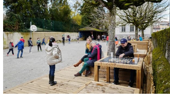
Cour du Bluard en 2024