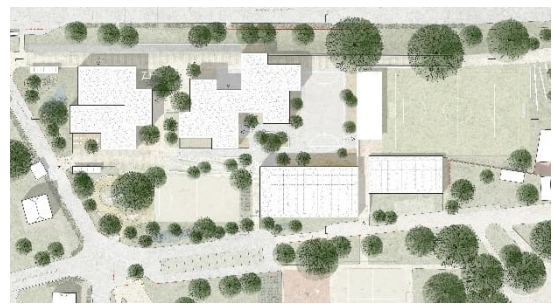
Projet paysager du Collège de la Gracieuse