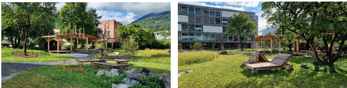
Préau du Collège du Reposieux

Le projet du Collège du Reposieux, à Monthey, réalisé en 2023-2024 a été co-construit avec les élèves depuis les phases de projet jusqu'à la réalisation en une année scolaire. Ce projet participatif a transformé un préau minéral en nouvel espace public accueillant, arboré et offrant différents usages. Ce projet a également favorisé l'utilisation de matériaux locaux dans une démarche écologique et d'optimisation des coûts.