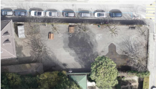
Cour du Bluard en 2023

Ces aménagements répondent aux objectifs fixés par la Municipalité pour les espaces extérieurs des sites parascolaires.