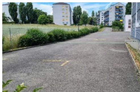
Vue depuis le sud de la cour