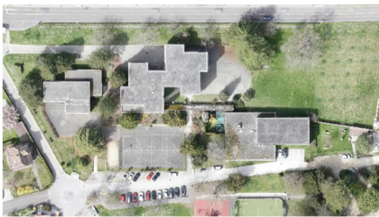
Collège de la Gracieuse en 2023

Ce projet répond aux enjeux et objectifs fixés par la Municipalité pour les cours d'écoles.