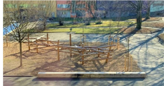
Avant/Après, radix.ch 12

Le projet mené à l'établissement secondaire Moudon-Lucens 13 et réalisé en 2022 a permis la participation des élèves à différents travaux comme la pose de rondins et de jeux d'équilibre, l'installation de copeaux, ainsi que les peintures du mur d'escalade. Il propose une zone végétalisée et plantée avec des assises ainsi qu'un espace adapté aux jeux et mouvements. Un des murs existants a été mis en valeur grâce à une fresque et un mur de grimpe.