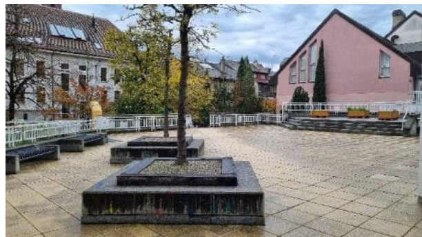
Préau du Collège des Charpentiers en 2023

Le réaménagement de cette cour d'école sera mené après une réflexion globale nécessaire pour ce secteur qui tient compte de l'ensemble des enjeux ainsi que des projets des propriétaires privés des bâtiments avoisinants (EMS, surface commerciales, parking, etc.). La Municipalité étudiera les modifications nécessaires du préau dans le cadre de ces réflexions.