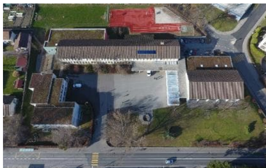
Collège de Chanel en 2018

Cet aménagement répond aux objectifs fixés par la Municipalité pour les cours d'écoles.