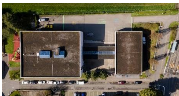
Site de la Burtignière en 2023

Afin de répondre à ces nouveaux enjeux et aux objectifs fixés par la Municipalité, l'élaboration d'un projet global d'aménagement est nécessaire pour cette cour d'école.