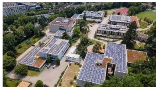
Site de Beausobre en 2023