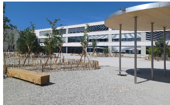
Collège de Chanel en 2024