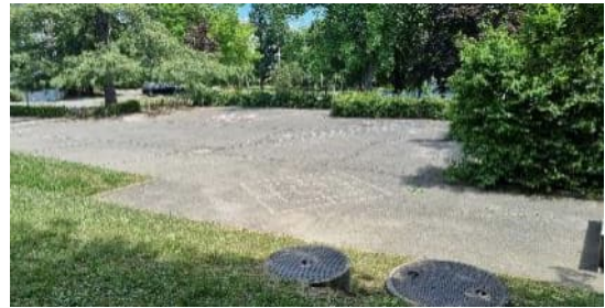
Vue d'une des cours du Collège de la Vogéaz