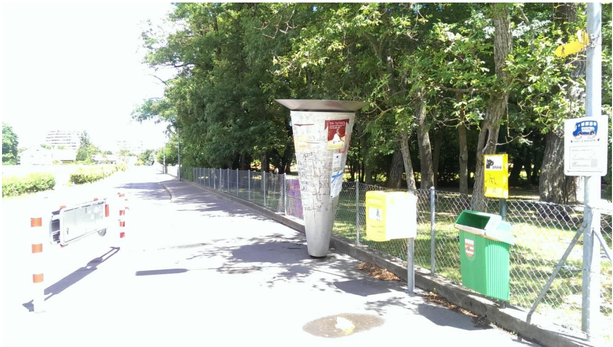
Il y a également une colonne Morris au croisement des chemins Prellionnaz et Tolochenaz.