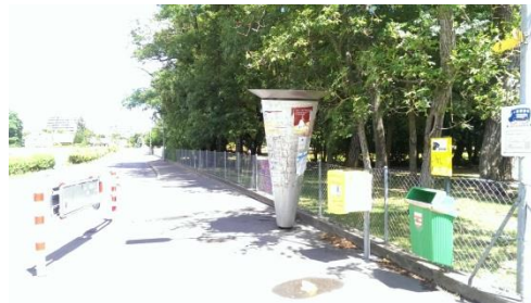
« Colonne Morris »