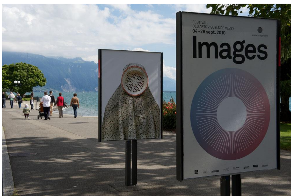
Exemple d'un affichage culturel SGA, format F4

Les demandes (au moins 3 mois en avance) doivent être adressées au Théâtre de Beausobre : 021 804 15 69, qui vous renseignera sur les disponibilités, et les modalités pratiques.