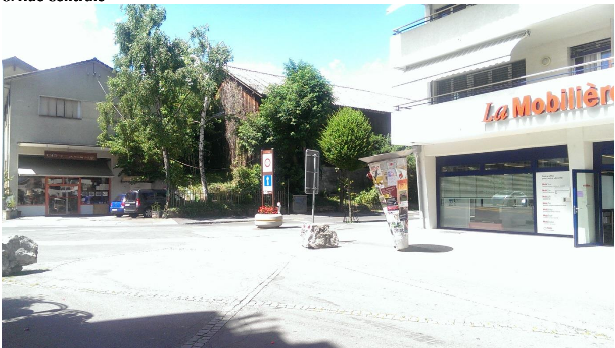
A proximité du croisement entre la Rue Centrale et la Rue Sablon, se situe une colonne Morris.